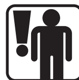
Dbát o bezpečnost osob