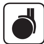
Vhodná pod kolečkové židle