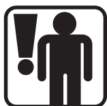
Dbejte o bezpečnost osob