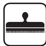
Speciální zubovou stěrkou - raklí, u samonivelačních stěrek