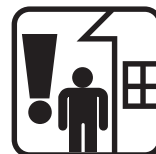
Dbát o bezpečí osob a majetku